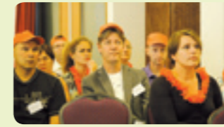
Managers en P&O'ers in discussie.