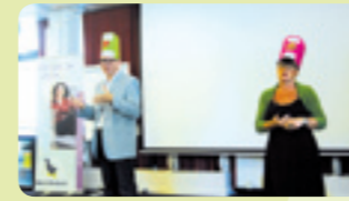
De meeting werd geopend met theater.