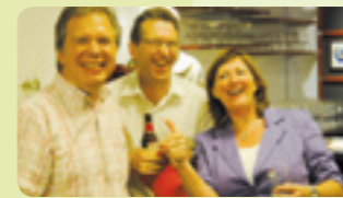
Borrel na afloop.