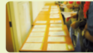
Zoek maar uit! Kandidaatprofielen.