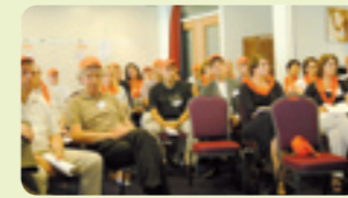
Managers dragen petjes, P&O'ers een krans.